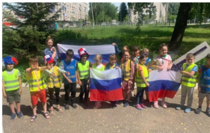
Мероприятия в редакции «Менделеевские новости», Городском архиве.